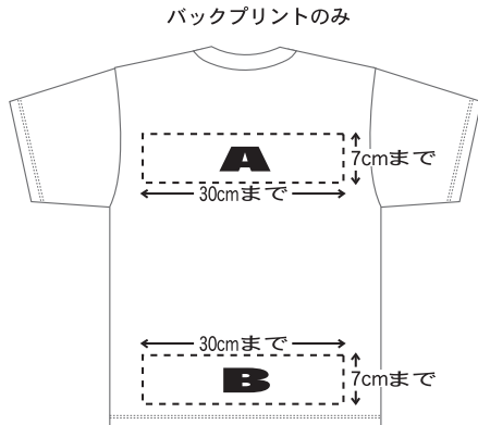
チーム単位10枚以上

チーム単位で10枚以上、共通のTシャツカラーで 記念Tシャツ(¥2,200)に +¥600 で貴校のチーム名を背中にプリント致します!